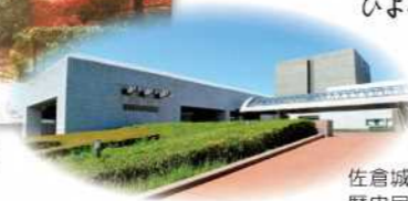
佐倉城址公園の中には国立歴史民俗博物館があります。