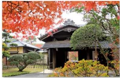
旧堀田邸・さくら庭園