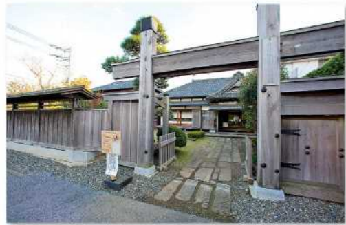
佐倉順天堂記念館