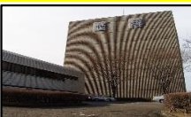
⑤国立歴史民俗博物館